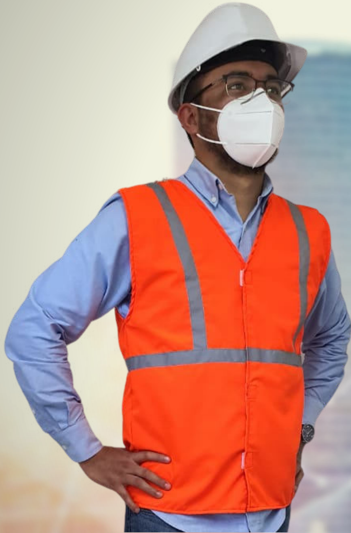
CHALECO INDUSTRIAL CO: CI13