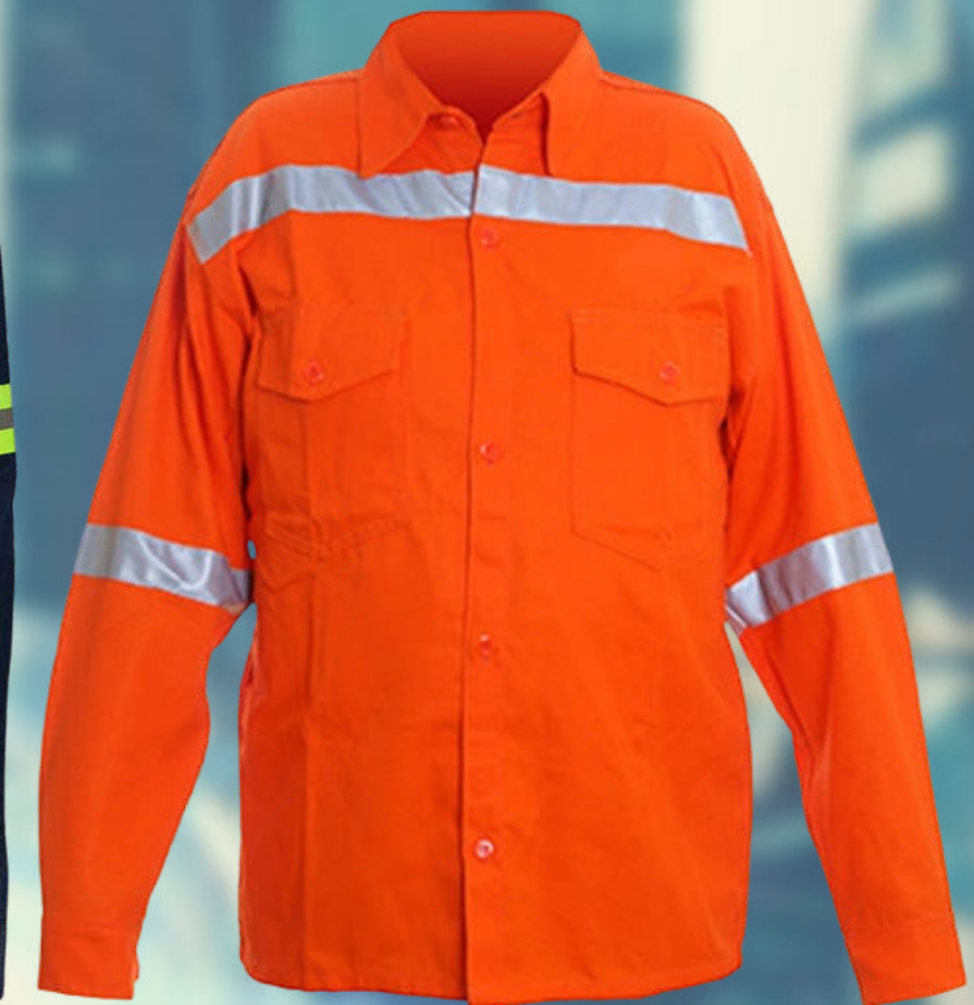
CAMISA INDUSTRIAL DE LONA CO: CC10