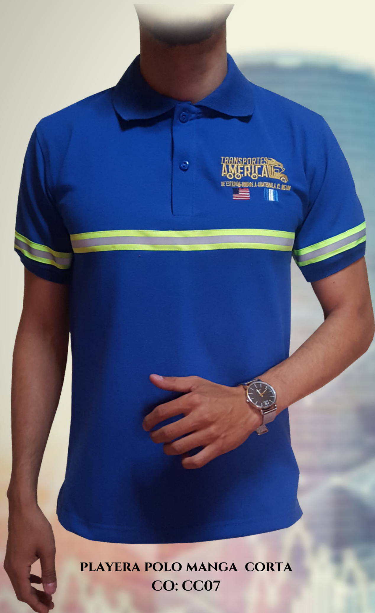
PLAYERA POLO MANGA CORTA CO: CC07