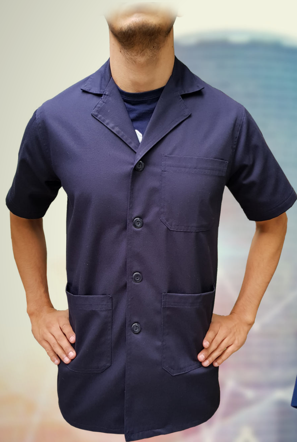
BATA INDUSTRIAL CO: BT16