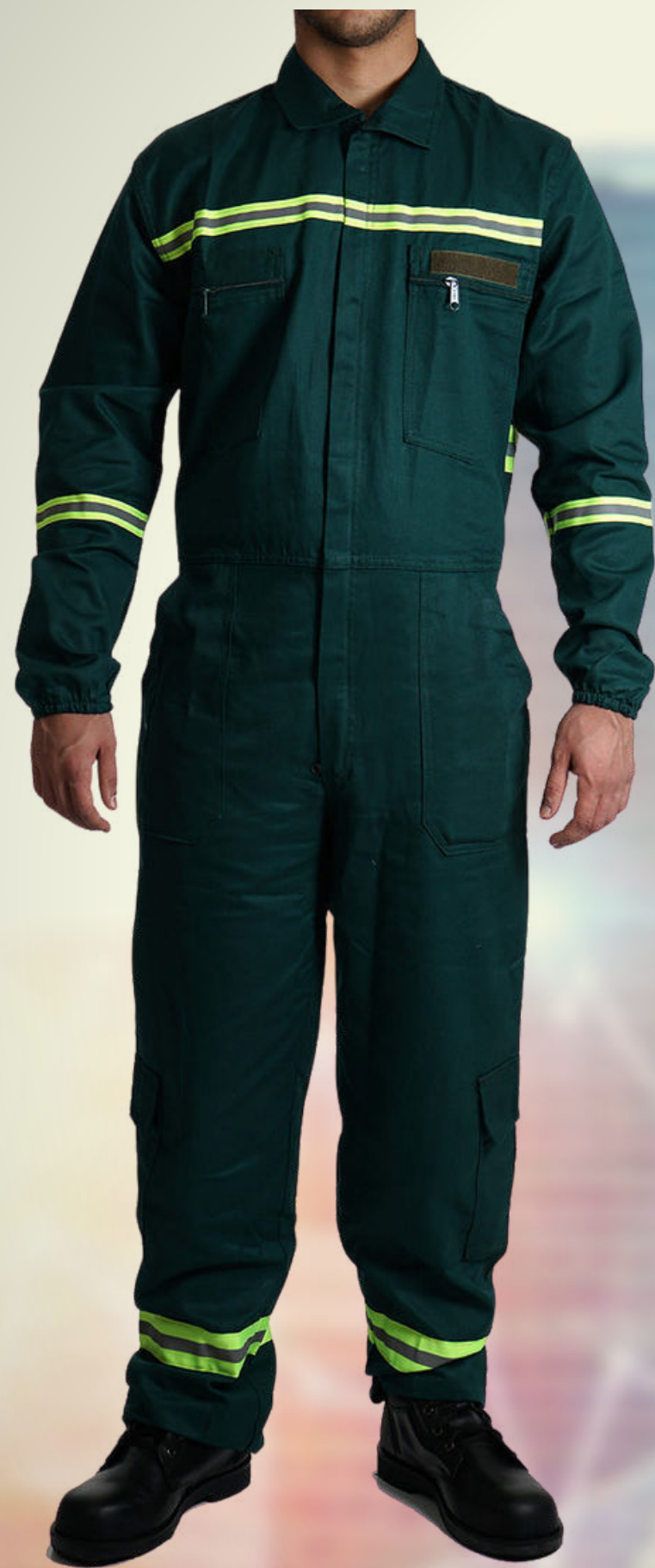
OVEROL INDUSTRIAL CO: OVI5