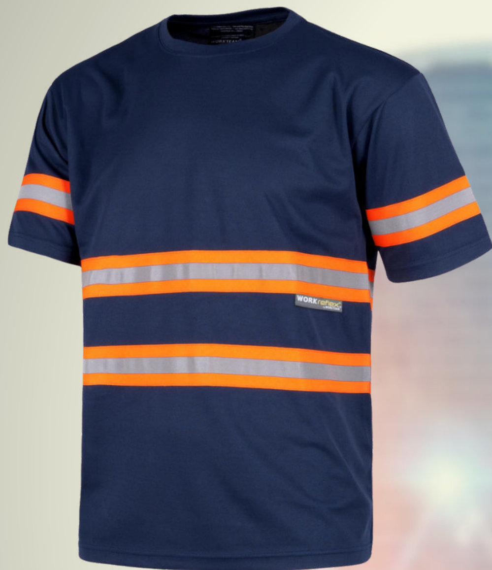
PLAYERA MANGA CORTA CO: CC05