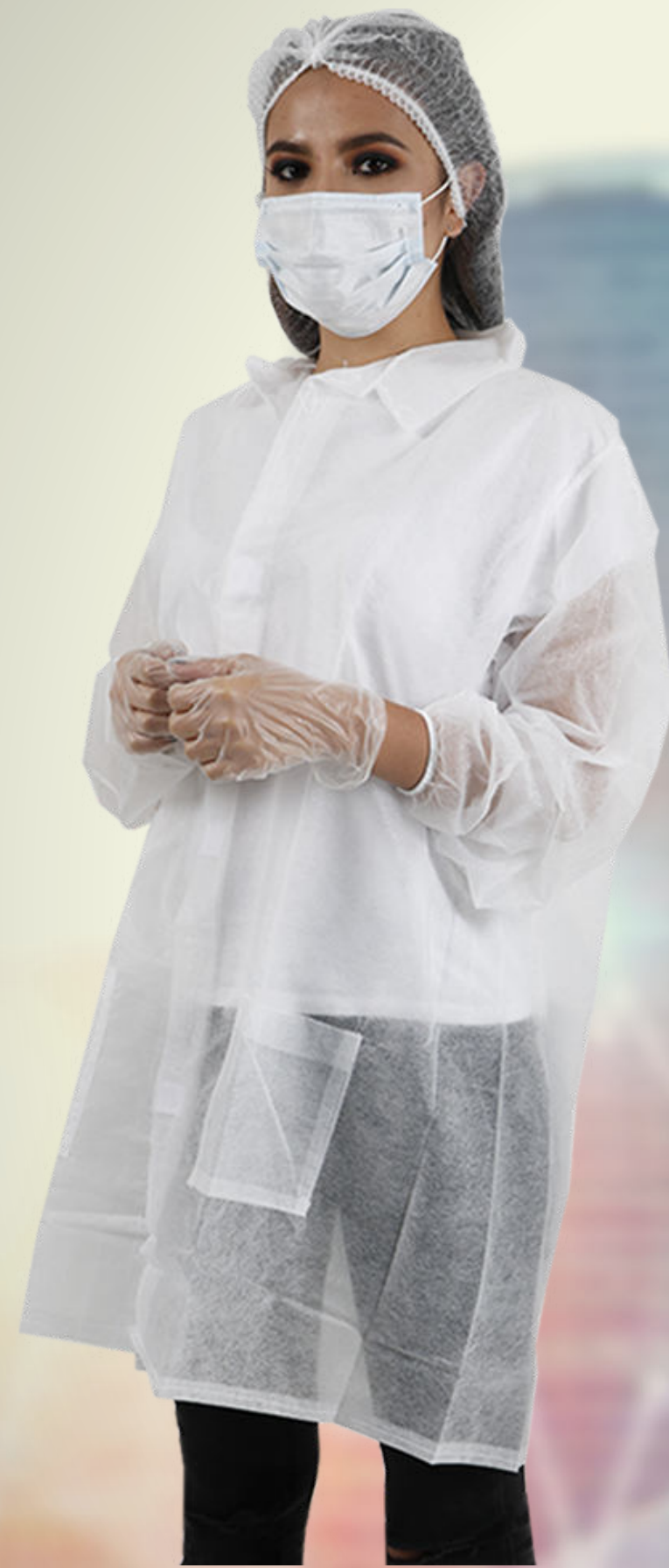
BATAS DESECHABLES CO: BTDI7