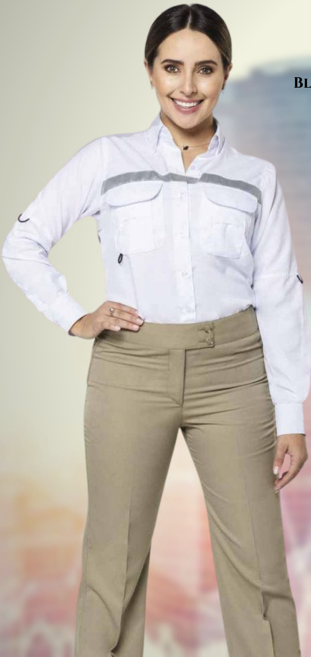
BLUSA TIPO COLUMBIA MANGA LARGA CO: CC03