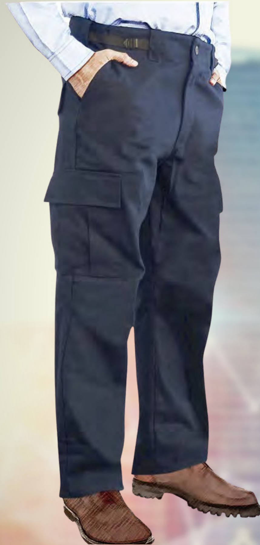
PANTALON COMANDO CO: PCII