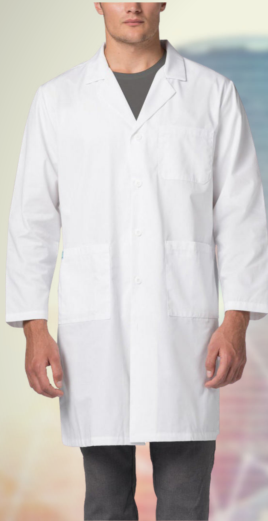
BATA LABORATORIO CO: BT16