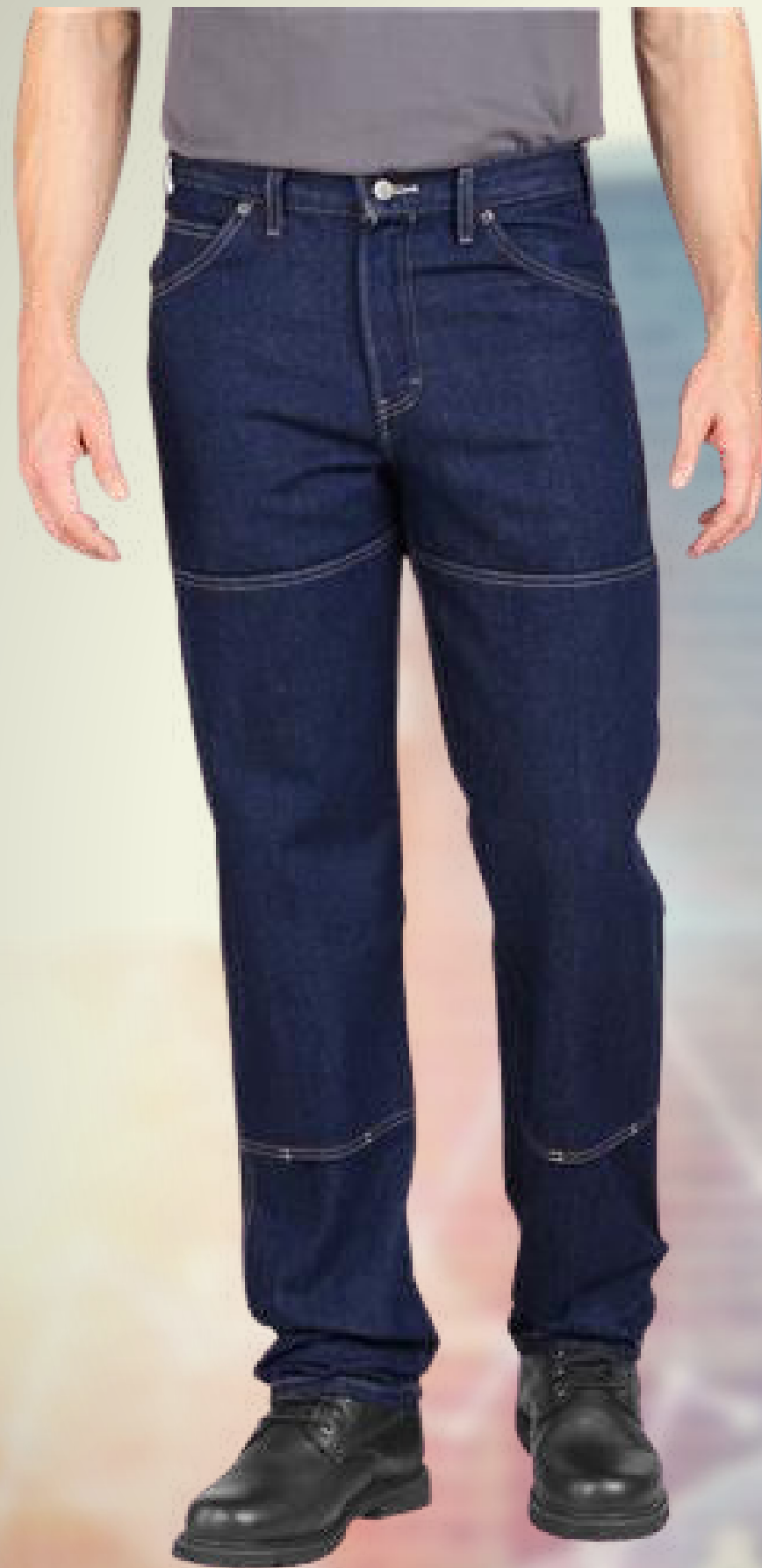
PANTALON INDUSTRIAL CO: PI12