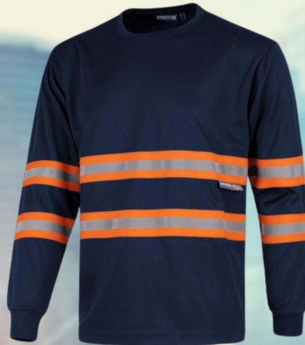
PLAYERA MANGA LARGA CO: CC06