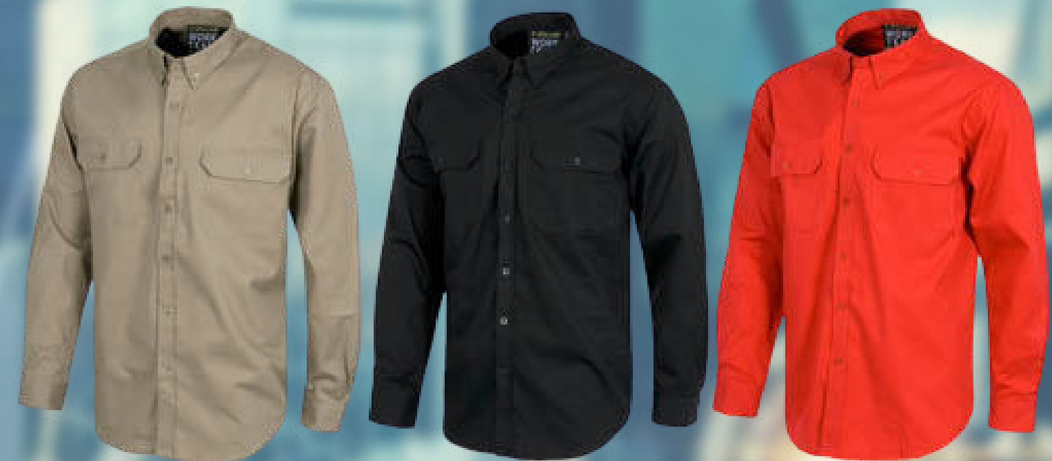
CAMISA INDUSTRIAL OXFORD CO: CC09