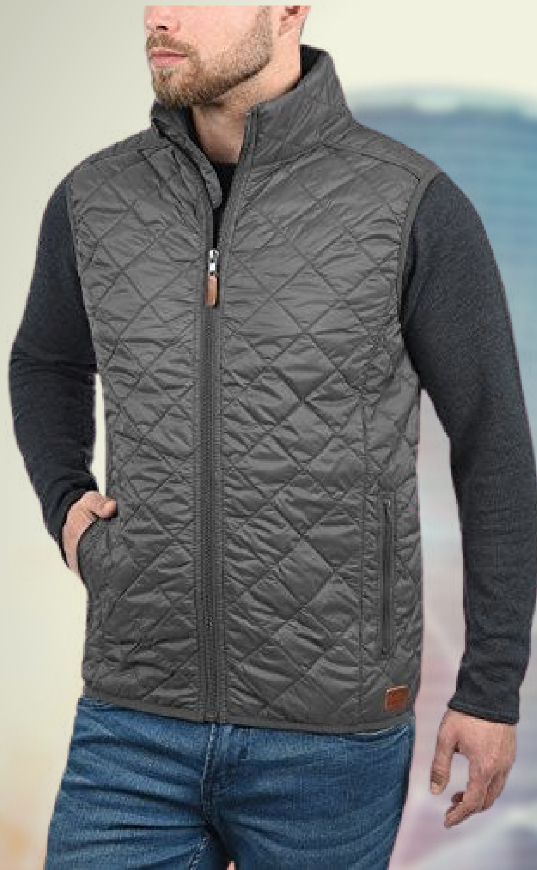
CHALECO EMPRESARIAL CO: CI14